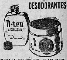
REGULA LA TRANSPIRACION DE LAS AXILAS Y LAS DESODORIZA POR VARIOS DIAS

Al mismo tiempo se inauguró un laboratorio para la aplicación de isótopos radioactivos a la agricultura en los trópicos. Está equipado con los instrumentos más modernos como también con todos los accesorios necesarios para tal clase de trabajo. Ya se han iniciado estudios sobre la fertilidad de suelos usando fosforo radioactivo. Gradualmente se intensificarán estos estudios, especialmente sobre la nutrición de plantas tropicales, para el beneficio de la agricultura en América Latina.